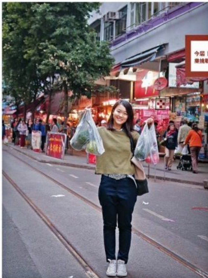
新鮮出爐! 今屆「香港社會企業挑戰賽」第二名

上一代創業，要賺第一桶金，總想生意愈做愈大，然後買樓買車，這樣的想法，對90後來說，早已過時，而且今時今日的經濟環境與70、80、90年代也大相逕庭，根本無法比擬。以自己的經歷和時代來批判眼下這一輩，沒有意義，也